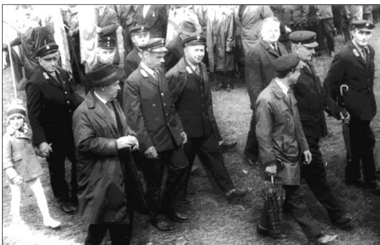
Postai dolgozók az 1972. május 1-jei felvonuláson

Havonta nagyjából 90 féle újságot értékesítettek a postások, 50–52 ezer példányban. A hetilapokat előfizetők száma 2634 fő volt. A Népszabadság előfizetők száma 382, a Békés megyei Népszabadságot pedig 544 helyre járatták. Az Aranykalász Tsz 50 tag részére fizetett elő központilag a Békés megyei Népszabadságra, ezzel nagyban hozzájárult a pártbizottság által a postahivatal részére kiűzött feladatok teljesítéséhez, melyben jelentős helyen szerepelt a központi és a megyei pártlap terjesztése.