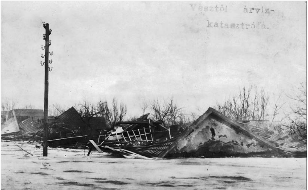
A Hatház elnevezésű településrészről készült árvízi képeslap, 1926