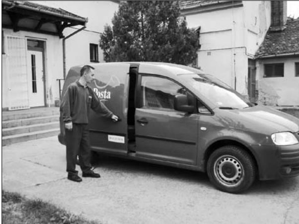
A postautó indulásra kész

A felvételben dolgozók a napi feladataik mellett biztosítás-közvetítésével is foglalkoznak. Munkájuk színvonalas ellátásáért, az ügyfelekkel történő közvetlen és jó kapcsolat elismeréseként elnyerték az „Ügyfélbarát posta” elismerést.