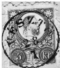
Vésztói postabélyegző lenyomata, 1870-es évek

1867-ben a kiegyezés lényegesebb pontjai között szerepelt, hogy a posta- és távírda-ügyet – önállóságuk megőrzése mellett – összehangolják. A hivatalos nyelv a postán is a magyar lett, így a postai alkalmazottaknak sem volt előírt követelmény a német nyelvtudás.