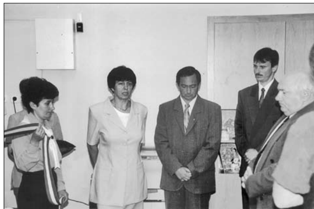
A TelepostaHáz ünnepélyes átadása, 2000