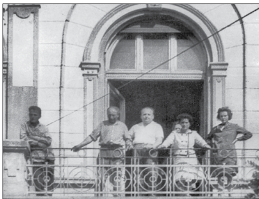
Postások a tanácsháza erkélyén 1965-ben

1965-ben a régi, korszerűtlen, egészségtelen és túlszűfolt postaépület teljes felújítását végezték el. A régi, elavult, megfelelő szociális helyiségekkel nem rendelkező épületben a hivatal területét az ugyanott lévő lakás területével bővítették, a lakók részére pedig a Várkonyi utcában építettek megfelelő lakást. A lakás építéséhez a Magyar Posta 100 ezer forinttal, a község pedig 80 ezer forinttal járult hozzá. A postahivatal felújítása és bővítése idején a postai szolgáltatásnak a tanácsháza nagyterme adott helyet, a telefonközpont kivételével a postahivatal hónapok át ott működött.