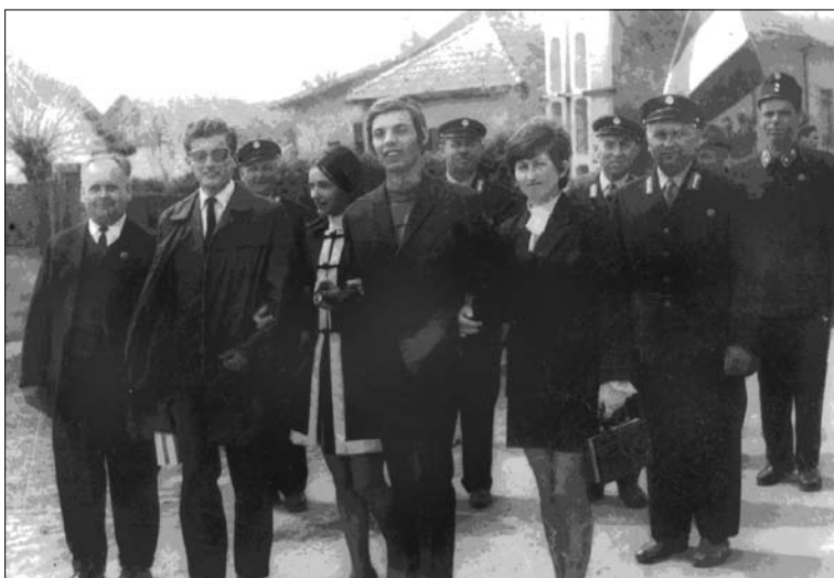
Postások az 1974. május 1-jei felvonuláson