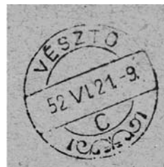
A vésztői postabélyegző lenyomata, 1952

Öt kerékpáros kézbesítő, egy távirat-kézbesítő és két lovas kézbesítő hordta a küldeményeket, az utóbbiak a település igen nagy kiterjedésű külterületeire. A lovak a posta tulajdonában voltak, de tartani a