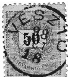
Vésztói postabélyegző lenyomata, 1898